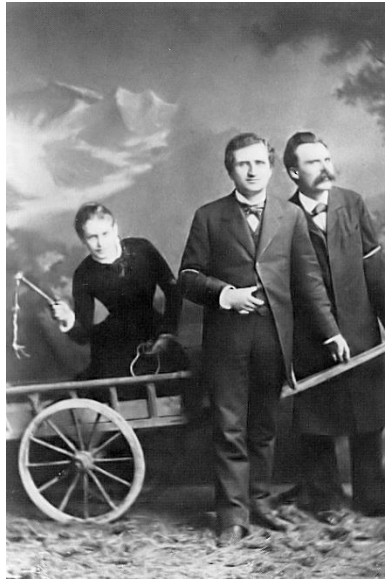
Lou Andreas-Salomé, Paul Rée e Nietzsche, 1882.